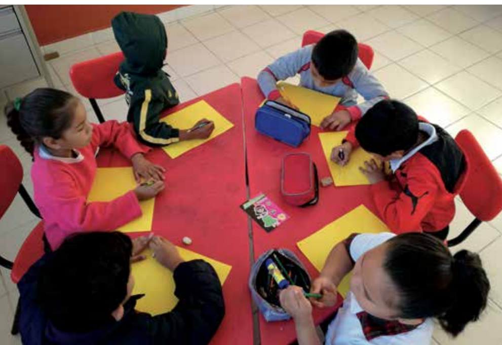
Infants de l'escola multigrada Alfonso Arroyo Flores del municipi Puente Nacional, estat de Veracruz.

tota una vida d'experiències en l'escola rural que no coneix ningú». Sifuentes explica que alguns col·lectius de mestres que participen en espais de conversa per a docents multigrada han començat a dissenyar conjuntament materials educatius i a establir grups de suport. «Es comencen a moure estructures que esperem que aviat es tradueixin en polítiques», afirma Sifuentes. I conclou: «Ningú no s'ha assegut i ha pensat en l'educació rural des de les altes esferes, però ho estem fent nosaltres des de baix. I potser, si empenyem prou, algun dia ens escoltaran». ●