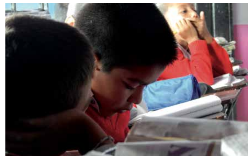
Detall de les classes a l'escola rural multigrada de Totoapita, al municipi d'Acatlán, estat d'Hidalgo.

infants i treballar-hi comunitàriament. Herrera explica que, a l'inici de la seva pràctica professional, esperava trobar una fórmula per afrontar l'ensenyament en aquest tipus d'escoles. Amb el temps, però, va descobrir que «no hi ha receptes, sinó un esforç constant per conèixer la comunitat i actuar-hi d'acord amb les necessitats que té».