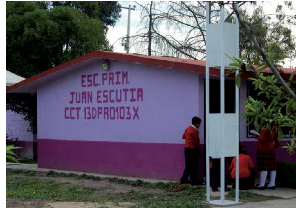
A l'escola rural Juan Escutia de Totoapita aprenen una vintena d'alumnes, d'entre 5 i 12 anys, en un mateix espai.

A l'inici de la seva pràctica professional, recorda, planificava separatament cada curs basant-se en materials didàctics ideats per a escoles d'organització completa. A partir dels aprenentatges adquirits a l'especialització en educació multigrau, va decidir basar la seva pràctica docent en projectes. A l'inici, confessa Tezoco, temia perdre massa temps, que els infants es distraguessin o no arribar a complir els objectius curriculars. Amb el temps ha identificat que la clau és parar atenció als interessos dels infants. En assemblea, el grup decideix quins temes els interessa tre-